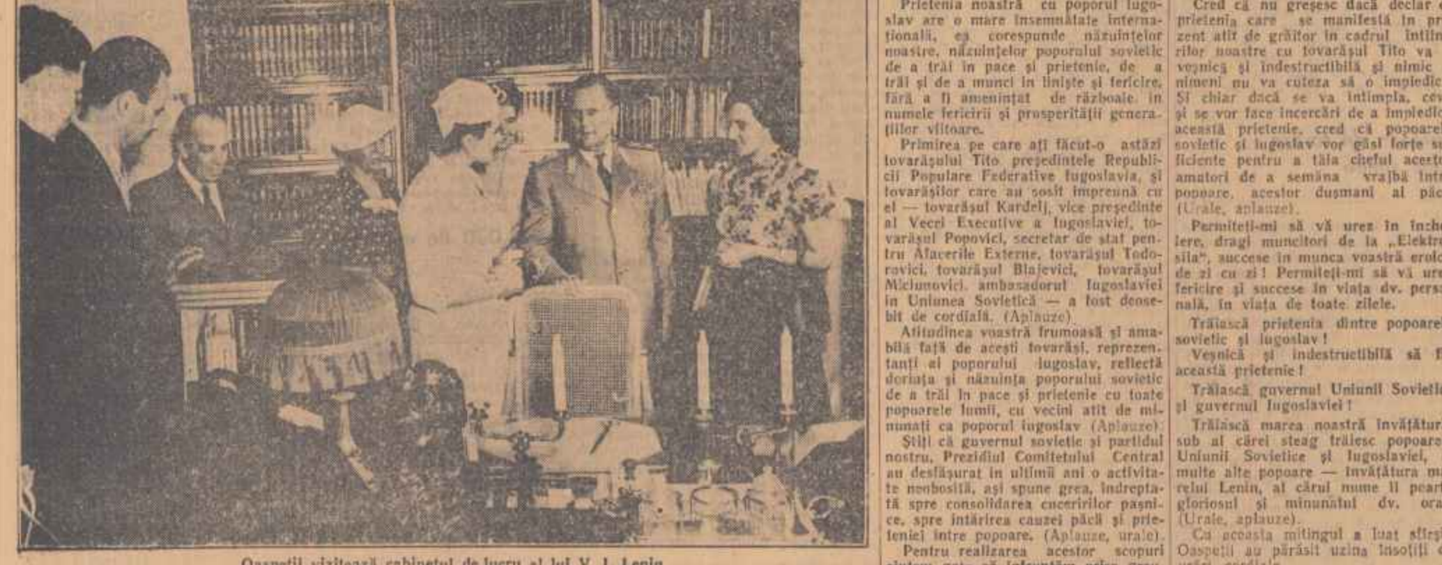
Oaspeții vizitează cabinetul de lucru al lui V. I. Lenin

TEATRE: Teatrul de Operă și Balet al R.P.R. 19.30: Tosca; Național B. J. Căozăie (sala Comediei) 19.30: Galerii; Național „I. L. Caragiale” (sala Studio) 19.30: Cupa Războiului; Armata (sala Magheru) 19.30: Drăculea Breze; Armata (sala din Calea B. Septemvriei) 19.30: Nunta lui Figaro; Municipal 19.30: Nunta lui Figaro; Opera 19.30: Lăsal-mă să cânt; Municipal C.F.R. (Giulești) 19.30: Titania Va; Teatrul 19.30: Studiu actorului de film „C. Noitaru” 19.30: Neta zero la purtare; Anunșul de estradă al R.P.R. (sala din Calea Victoriei) 17.45: Melodi... Melodi... Melodi... Anunșul de estradă al R.P.R. (Giulești) 19.30: Gălătoria pe noie; Yandăreică (sala Orfeu) 20. 2-9 pentru noi; Tandăreică (sala din str. Academiei) 16: Bălănuș și vînt; Cîrcel de Stat 20.30: Arena primăverii. CINEMATOGRAFIE: Patria, Mogyloș, Ganga, Maghera, V. Alecsandri, București, Întrădăria între popoare.