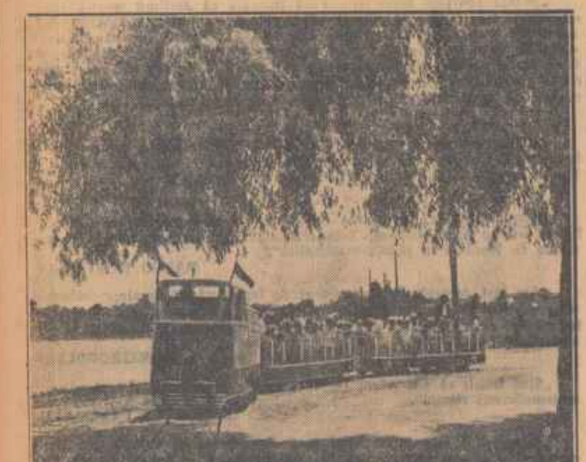
Copiii sînt primăvara vieții. Pentru fericirea lor, statul nostru nu precupește nici un efort pentru a le crea și pune la dispoziție tot ceea ce-i înclină și le face plăcere.