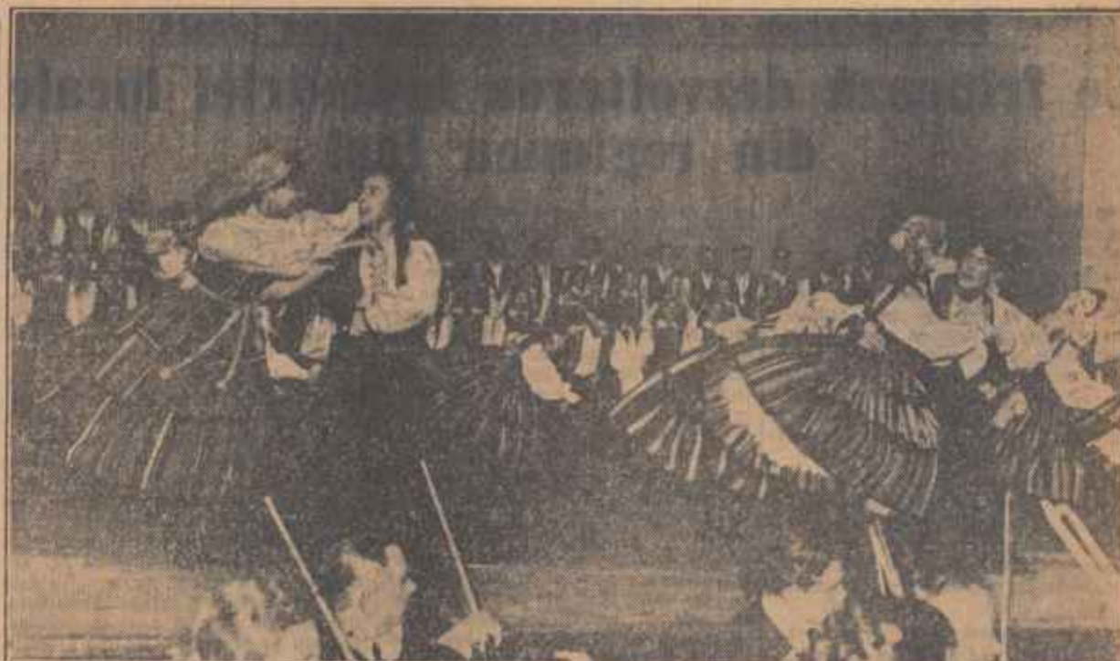
Ansamblul de cîntec și dansuri populare „Mazowsze” din R. P. Polonă a dat primul spectacol, în Capitală. În clișeu: Un aspect din timpul spectacolului.