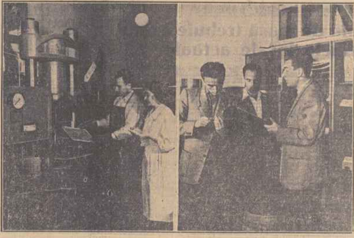
În cadrul stației pilot a Institutului de cercetări și experimentare pentru industrializarea lemnului se desfășoară o vastă acțiune științifică pentru valorificarea lemnului sub formă de semifabricate superioare.

Recent, Consiliul de Miniștri al Republicii Populare Romîne a aprobat hotărîrea privind stabilirea duratei zilei de lucru sub 8 ore pe zi pentru anumite categorii profesionale care prestează muncă în mod efectiv în condiții grele.