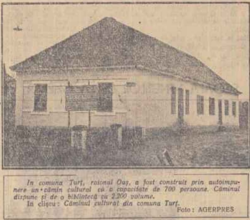
În comuna Turț, raionul Oas, a fost construit prin autoimpunere un cămin cultural cu o capacitate de 700 persoane. Căminul dispune și de o bibliotecă cu 2.200 volume. În clădire: Căminul cultural din comuna Turț.