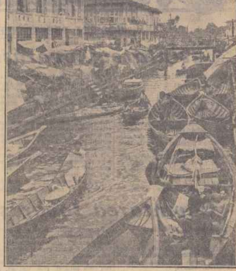
Multe din orașele indoneziene au fost întemțate la gurile rîurilor și fluviilor ce se varsă în apele mării care scaldă pămîntul indonezilor. În clipse: O vedere din orașul deosebit de animat, Pontianak, la gura rîului Kapuas. Multor turiști din străinătate acest oraș le amintește de Veneția.