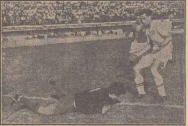
O fază din meciul de fotbal Locomotiva București — Dinamo Orașul Stalin.

simple și pe bună dreptate, căci vine la număr câteva zile după victoria — de o manieră cu totul aparte — obținută de C.C.A. asupra formației engleze Luton Town. Acceptînd în total predeclarația ce o manifestă Progresul pentru jocurile pe teren propriu, unde n-a pierdut nici o partidă în actualul campionat, între cele două comportări, la scara interval de timp, ale echipei C.C.A. există totuși o prea mare disproporție de valoare. Fără să micșoreze meritele învingătorilor, care au folosit toată puterea lor de luptă pentru obținerea acestui rezultat, și care au lăbuit acolo unde a eșuat Luton Town, se cuvine să admitem că, în Oradea, C.C.A. a marcat o valoare sub pistoniul obținut. E vorba aici de un accident de comportare? Mai aproape de adevăr pare a fi faptul, semnalat la comentariul nostru după etapa precedentă, că formația militărilor dă șomne de oboselă, că e deci în declin. Jocu cu Luton Town, în care militarii au făcut o uriașă risipă de energie, ca să realizeze o splendidă victorie internațională, a contribuit la accentuarea acestei oboseli. În scurțul răgaz pînă la meciul de la Oradea, jucătorii