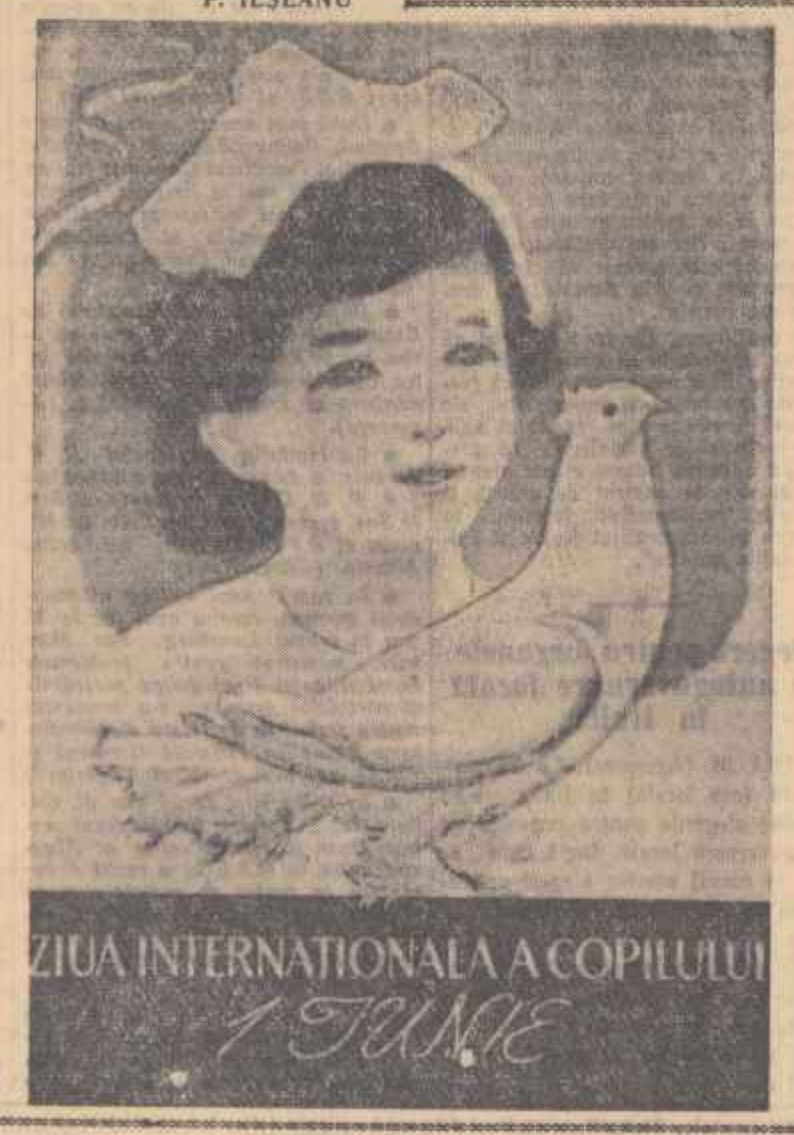
ZIUA INTERNAȚIONALĂ A COPILULUI

Criza politică din Pakistanul de est a izbucnit în urmă cu cîteva zile, cînd după discuții serioase în Adunarea legislativă a Pakistanului de est, președintele așdunării a refuzat să aprobă discutarea bugetului propus de ministrul principal al guvernului Pakistanului de est, Sarfar.