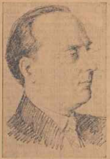
IOACHIM BOTOS, judecător, deputat în circumscripția electorală regională nr. 124