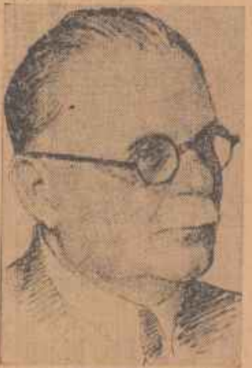
Dr. IULIANU BALUS, medic, deputat în circumscripția electorală regională nr. 8