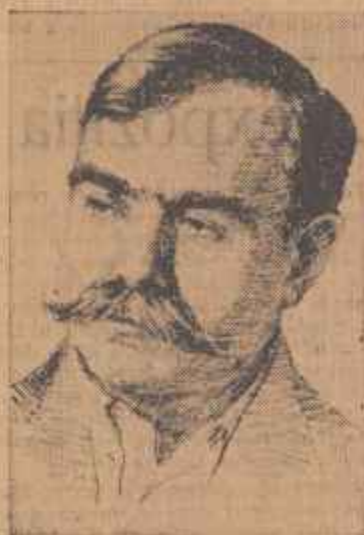
DUMITRU G. FILISEANU, inginer, deputat în circumscripția electorală regională nr. 44