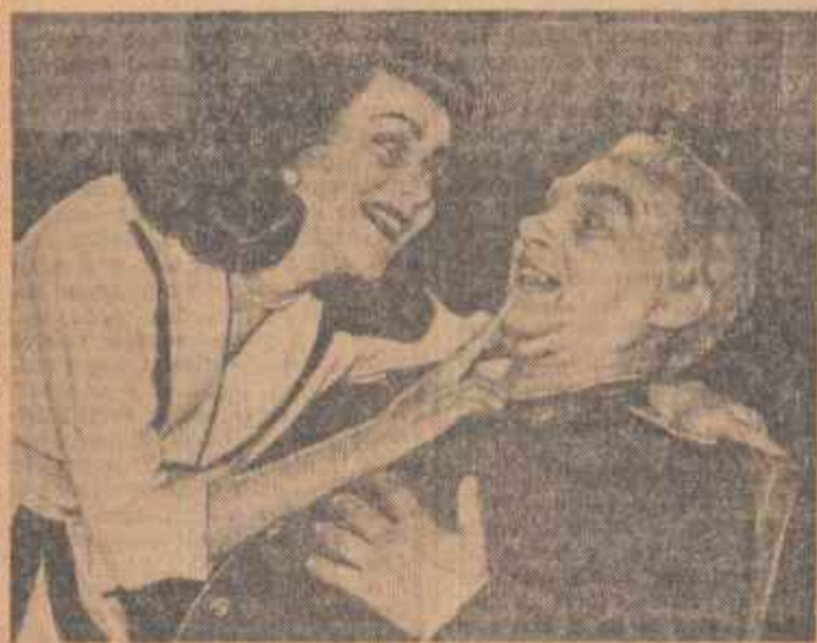
„Avansarea celui” de Eugen Neam a fost prezentată în fața juriului decadelor de către Teatrul de Stat Valea Jiului-Petroșani.