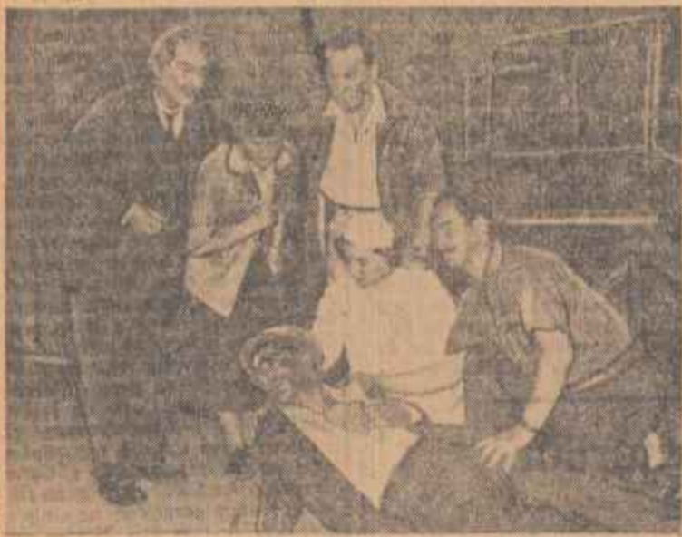
Scenă din finalul actului III din „La ora 6” în interpretarea Teatrului de Stat din Bacău.