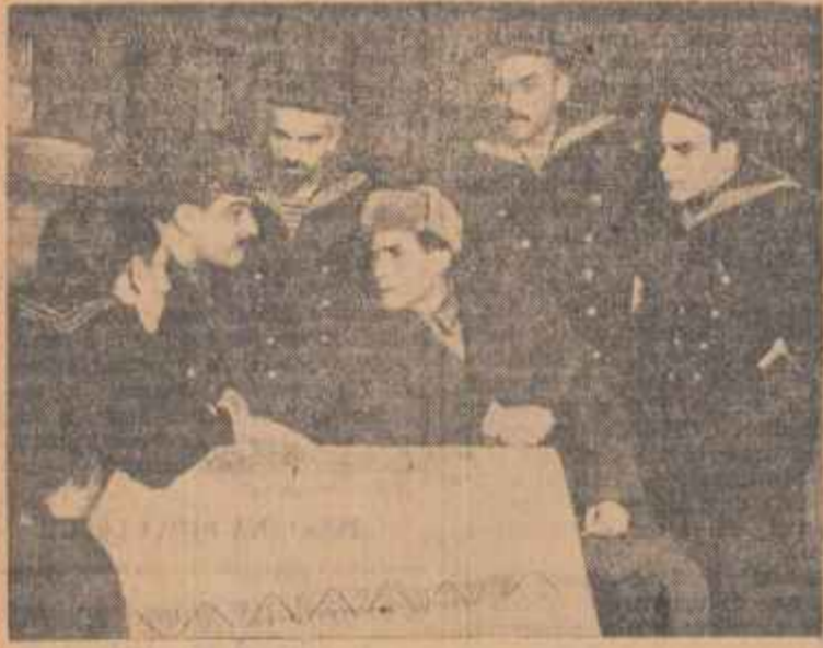
O scenă din premiera pe țară cu „Torporilor roșu” de Vladimir Colli în interpretarea Teatrului de Stat din Constanța.