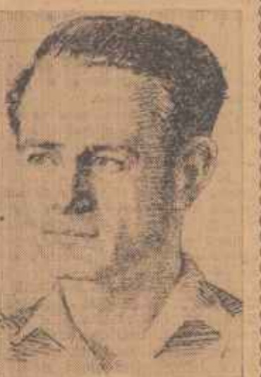
PETRE SAFTOIU, tehnician, deputat în circumscripția electorală regională nr. 158