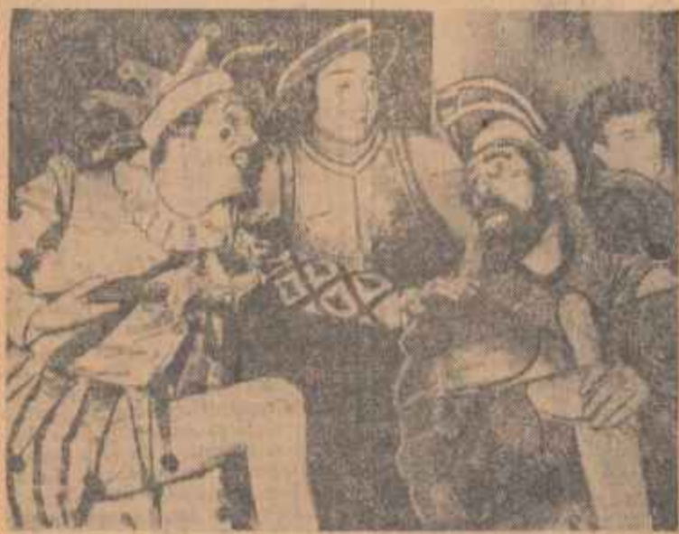
O scenă din „Preludiu” de Ana Novak, în interpretarea Teatrului de Stat din Galați