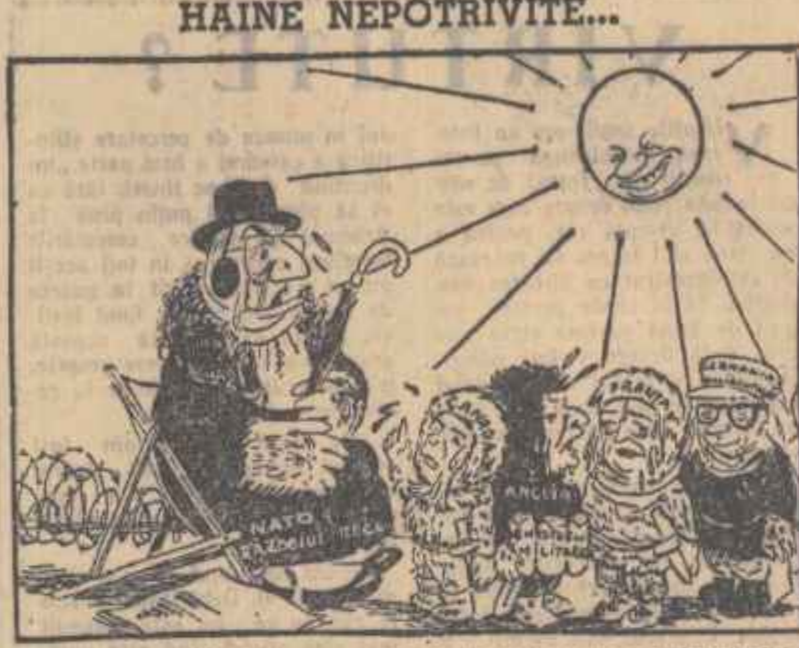
— Vă rog d-le Dulles, n-ar trebui să recurgem la o îmbrăcăminte mai potrivită cu clima? Desen de: Vicky. Din ziarul „DAILY MIRROR”

PRAGA 25 (Agerpres). — Ceteka transmite: În dimineața zilei de 25 mai Christian Pineau, ministrul Afacerilor Externe al Republicii Franceze, a vizitat orașul Praga. În după amiaza zilei de 25 mai Christian Pineau însoțit de ambasadorul Claude Bressat de Boisanger, s-au vizitat pe Václav David, ministrul Afacerilor Externe al R. Cehoslovaciei, la un sanatoriu din Praga, unde se află internat pentru tratament. Oaspetele francez a avut o conferință prietenească cu ministrul Afacerilor Externe al R. Cehoslovaciei, în seara aceleiași zile. Ch. Pineau și personalia care îl însoțesc au plecat spre Paris.