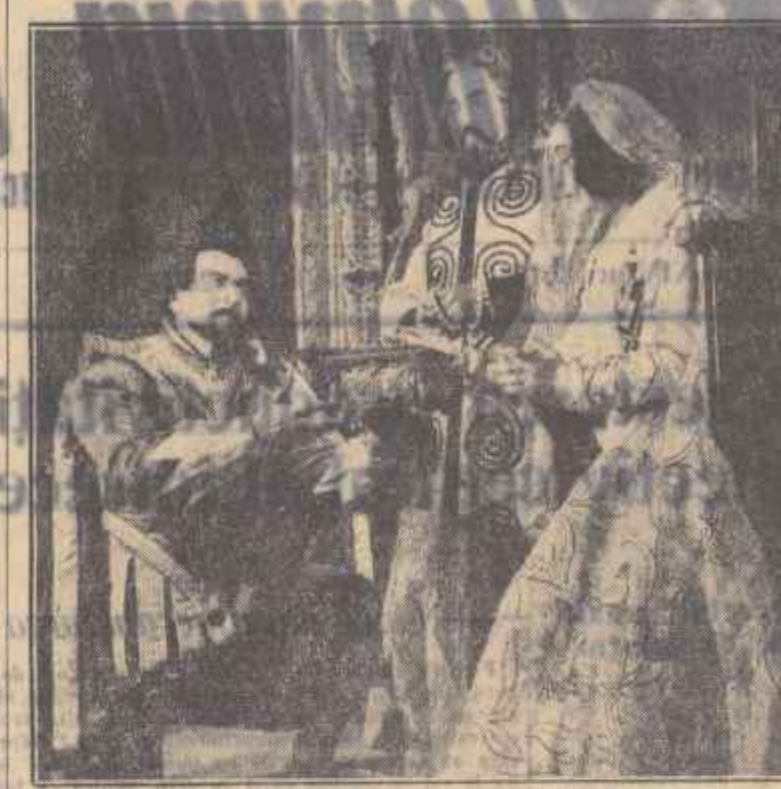
Urmărind interpretarea pieselor din literatura clasică românească, la Teatrul Armatei din Capitală s-a pus în scenă o nouă piesă...