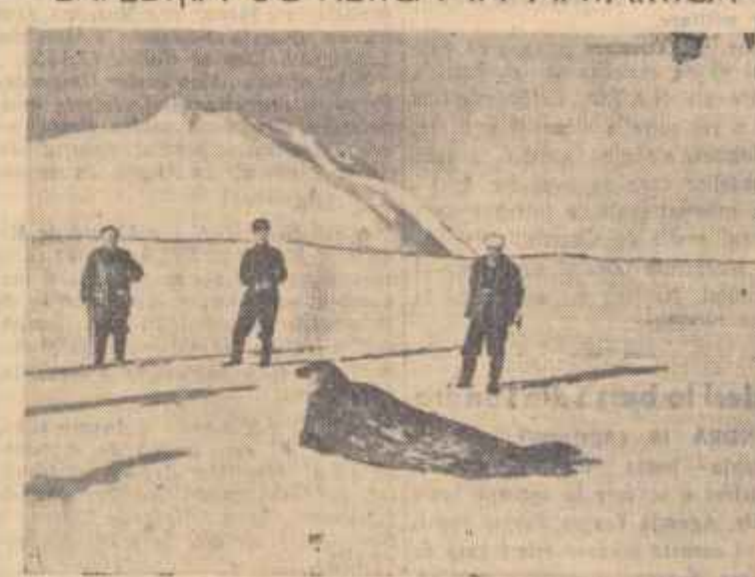
Prima expediție antarctică complexă sovietică continuă să-și desfășoare lucrările în regiunea așezării Mirnii. În câmp: Animalele din această zonă s-au obișnuit cu noii lor vecini. O locă „studii” cu atenție figurile exploratorilor sovietici.