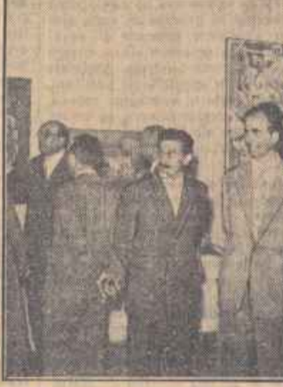
Aspect din timpul vizitării „Expoziției de pictură modernă iugoslavă”