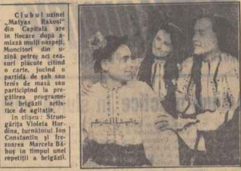
Clubul uzinei „Matyas Rakosi” din Capitală are în fiecare după-amiază mulți oaspeți. Muncitorii din uzină petrec aici ceasurile plăcute citind o carte, jucînd o partidă de șah sau tenis de masă sau participînd la pregătirea programelor brigăzilor artistice de agitatie.