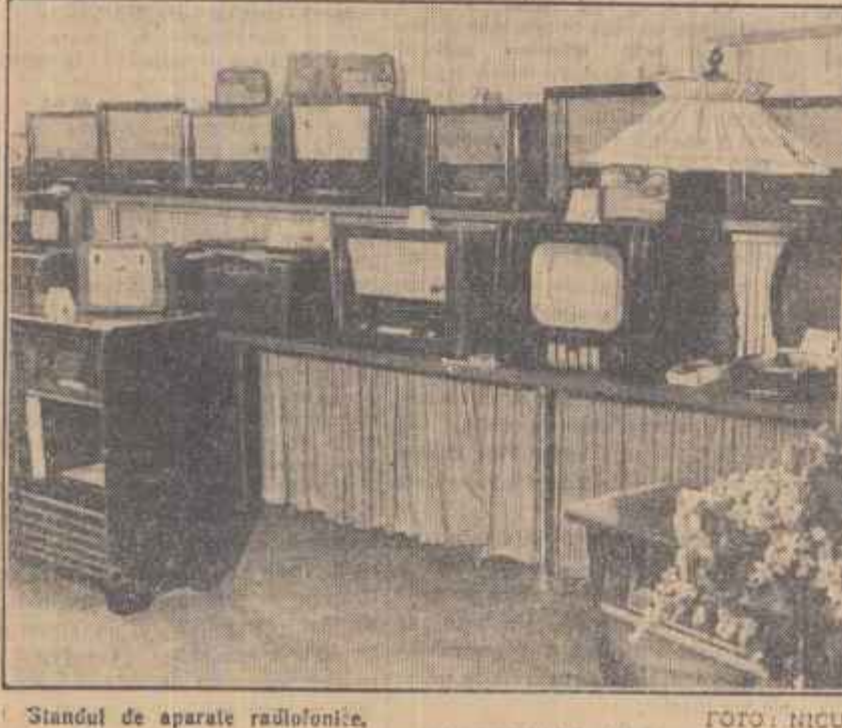
Standul de aparate radiofonice.

Critica exprîmată în mod grafic a fost urmată de o serie de măsuri,