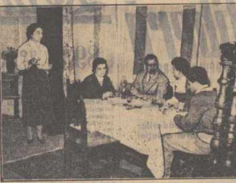
De curind pe scena Teatrului Tineretului...