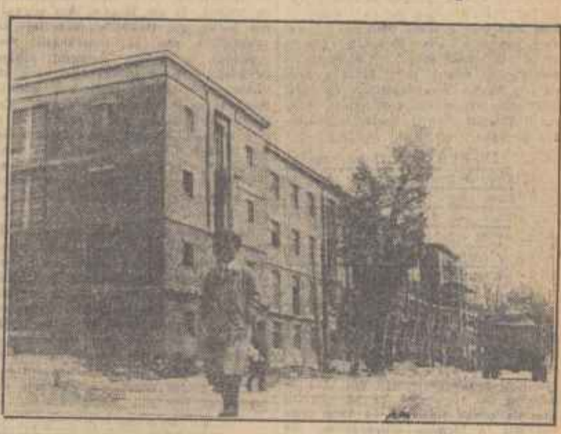
În diferite orașe ale țării s-au construit noi blocuri și locuințe pentru muncitorii patriei noastre. În clădire: Blocuri în construcție pentru muncitorii de la fabrica de antibiotice din Iași.