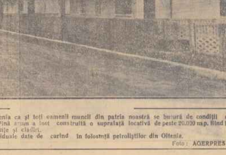
Muncitorii petroliferi din Oltenia ca și toți oamenii muncii din patria noastră se bucură de condiții de trai din ce în ce mai bune.

Simbătă 12 mai, ora 17, în sala Dalles concert-lecție cu subiectul „CEAI ROVSKI”. Conferențiar: L. C. Spiru.