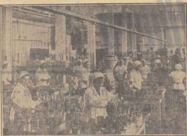
Combinatul de pește și semiconserva din Tulcea este una din cele mai moderne întreprinderi de acest gen.

— În urma sprâjnului acordat de întreprinderi industriale de interes republican. Din acest motiv, valorificarea deșeurilor provenite de la aceste întreprinderi în industria locală este o problemă principală în această regiune.