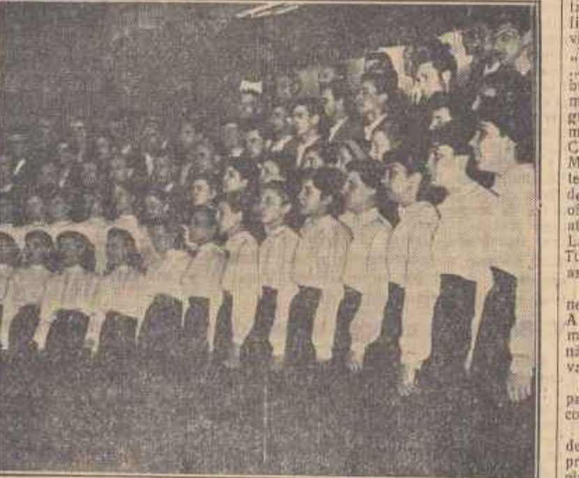
Un aspect de la spectacolul prezentat în sala Excelsior, Cîntă corul Institutului de Științe Economice și Planificare — V. I. Lenin.