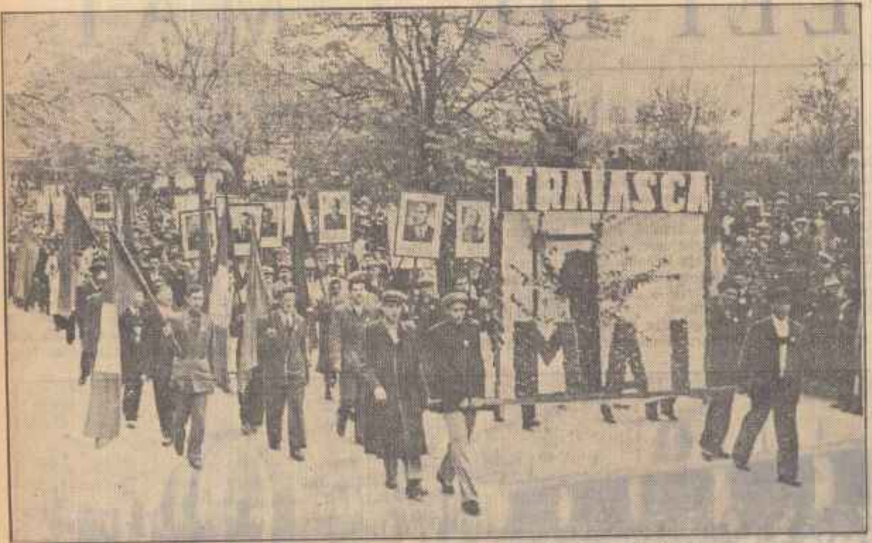
Un aspect de la demonstrația oamenilor muncii din orașul Galați.

la șantierul naval Galați au raportat despre terminarea noulor remorcare metalice și a șepurilor de 1000 tone, complet sudate. Pe ogoarele regiunii, 1 Mai a fost închinat cu realizări deosebite. Reprezentanții ai jăranilor muncitorilor au raportat că în raioanele Bujor, Galați, Măcin, Brăila și Filimon Sîrbu au fost terminate complet închinările de ter-