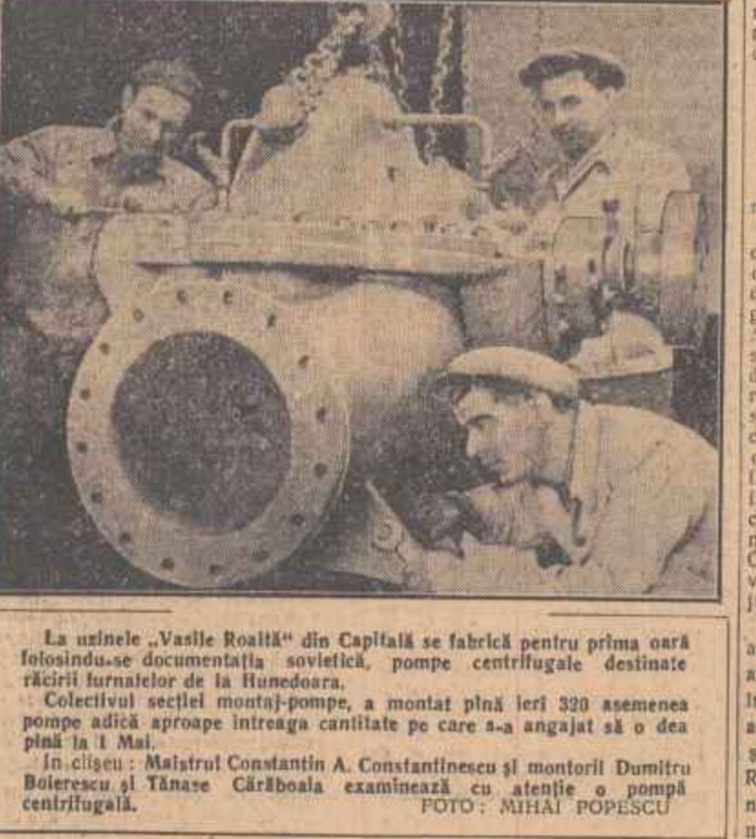
La uzinele „Vasile Roașă” din Capitală se fabrică pentru prima oară folosindu-se documentația sovietică, pompe centrifugale destinate răcirii furnalelor de la Hunedoara.