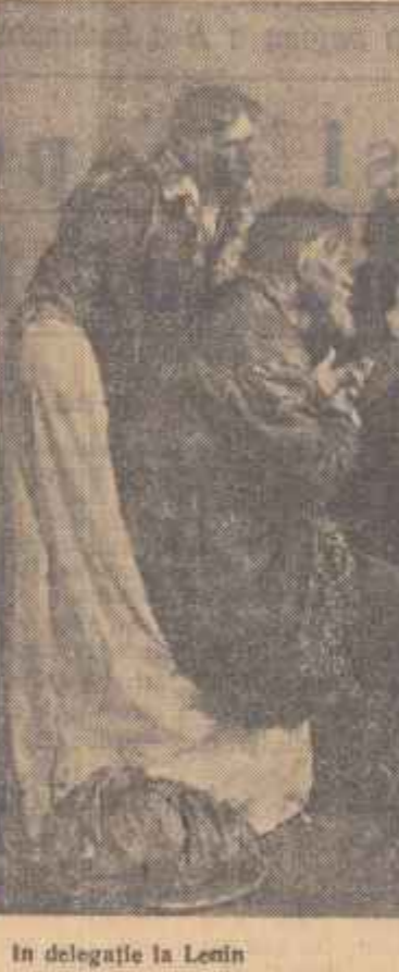
In delegația la Lenin. Pictură de V. SEROV

ELENA STASOVA *) Fragmente din amintirile unor contemporani ai lui Lenin