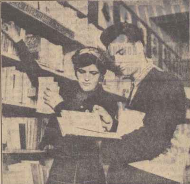
Cartea e din ce în ce mai iubită de cititori. Biblioteca centrală raională din Răcari a reușit să adune în jurul său numeroși tineri și vîrstnici care cercetează cu interes cele 15.000 de volume. În cișug: Biblioteca Elena Tudorache face recomandări unui cititor.