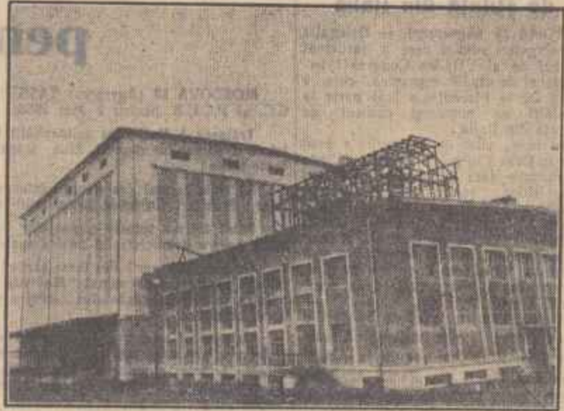
În ultimii ani în regiunea Craiova s-au construit numeroase întreprinderi. Clădirea noastră prezintă una din aceste noi construcții: fabrica de ulei din Podari, regiunea Craiova.