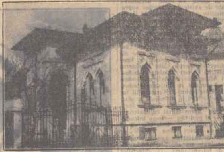
Casa din str. Cuza Vodă nr. 30 din București unde va avea loc duminică 15 aprilie înscenarea unei plăci comemorative.