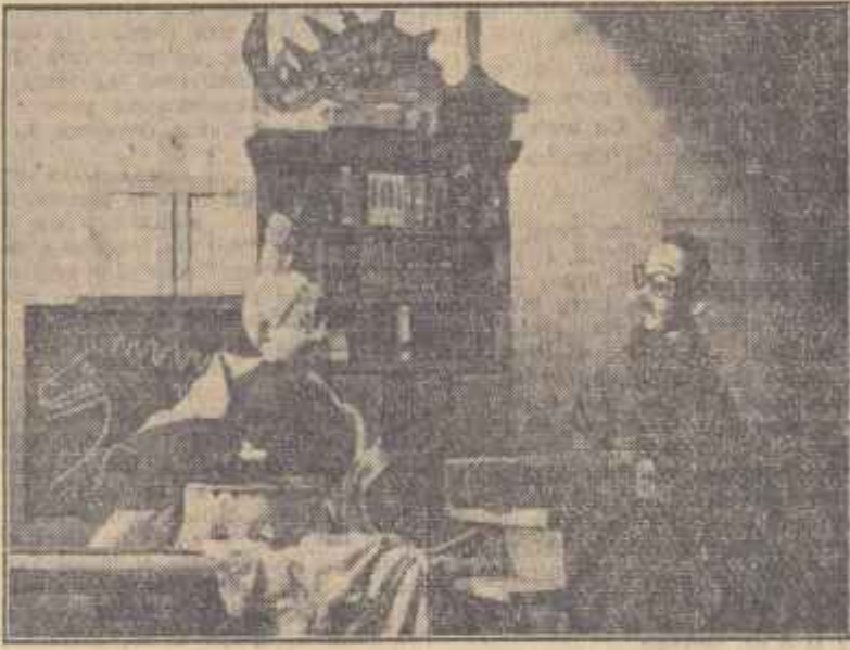
Astă seară, ansamblul de păpuși al teatrului Tândărică prezintă în premieră comedia sovietică „2-0 pentru noi” de V. Poliakov...