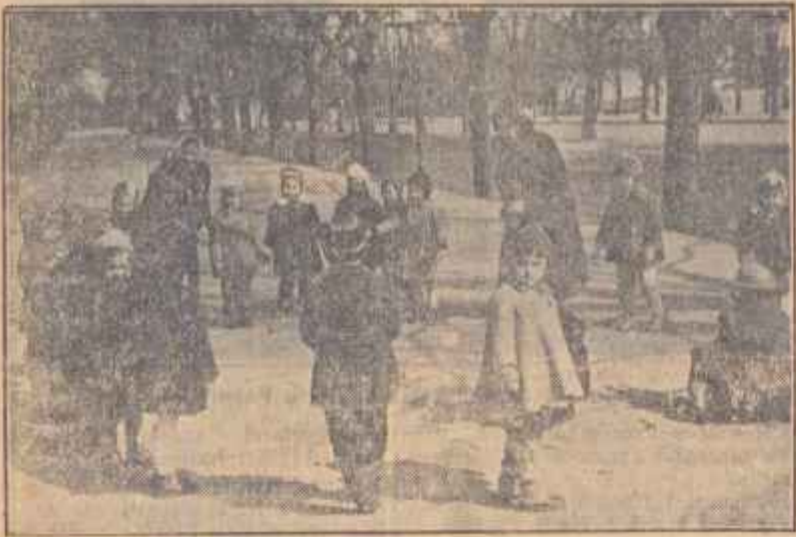
Cu toate că razele soarelui nu încălzesc încă destul, copiii au ieșit în joacă în aerul curat al primăverii.

ter, eu cunosco programul de activitate al fiecărui cerc și caut să trec săptămînal pe la fiecare din ele, discutînd cu acest prilej și participanții și despre nevoile lor, despre unele probleme gospodărești. În asemenea împrejurări, bunăoară, am putut afla că unii cetățeni nu puteau obține repartii de materiale pentru repararea imobilelor, deși făcuseră încă de mult cereri în această privință. Aducînd acest fapt la cunoștința comitetului executiv, în scurtă vreme, cetățenii respectivi au putut obține materialele solicitate. Cum responsabilii cererilor de cîntec sînt din comitetul de stradă, chiar atunci cînd nu pot trece personal pe la unii din aceste cereri, ei au grijă să mă pună în curent cu problemele ridicate de participanți.