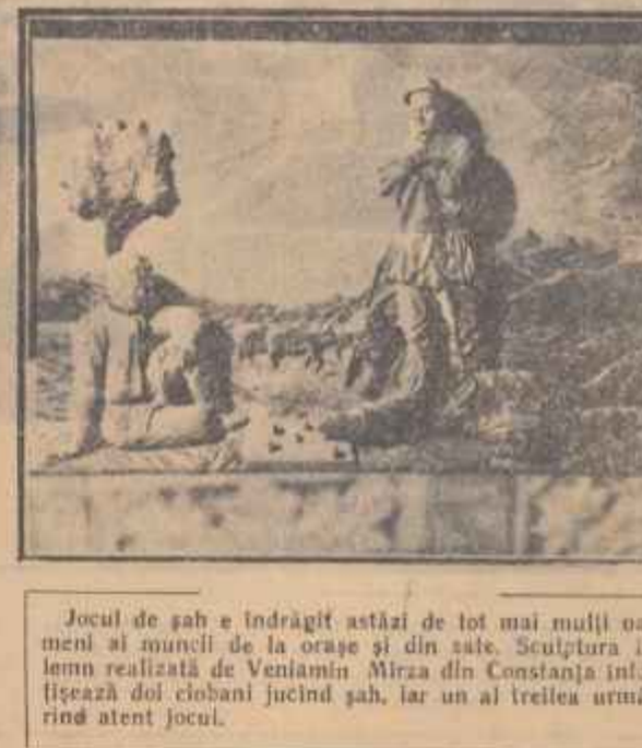
Jocul de șah e îndrăgit astăzi de tot mai mulți oameni ai tinerii de la orașe și din sate. Sculptura în lemn realizată de Veniamin Mirza din Constanța înțelege două cîmbi jucînd șah, iar un al treilea urmărește atent jocul.