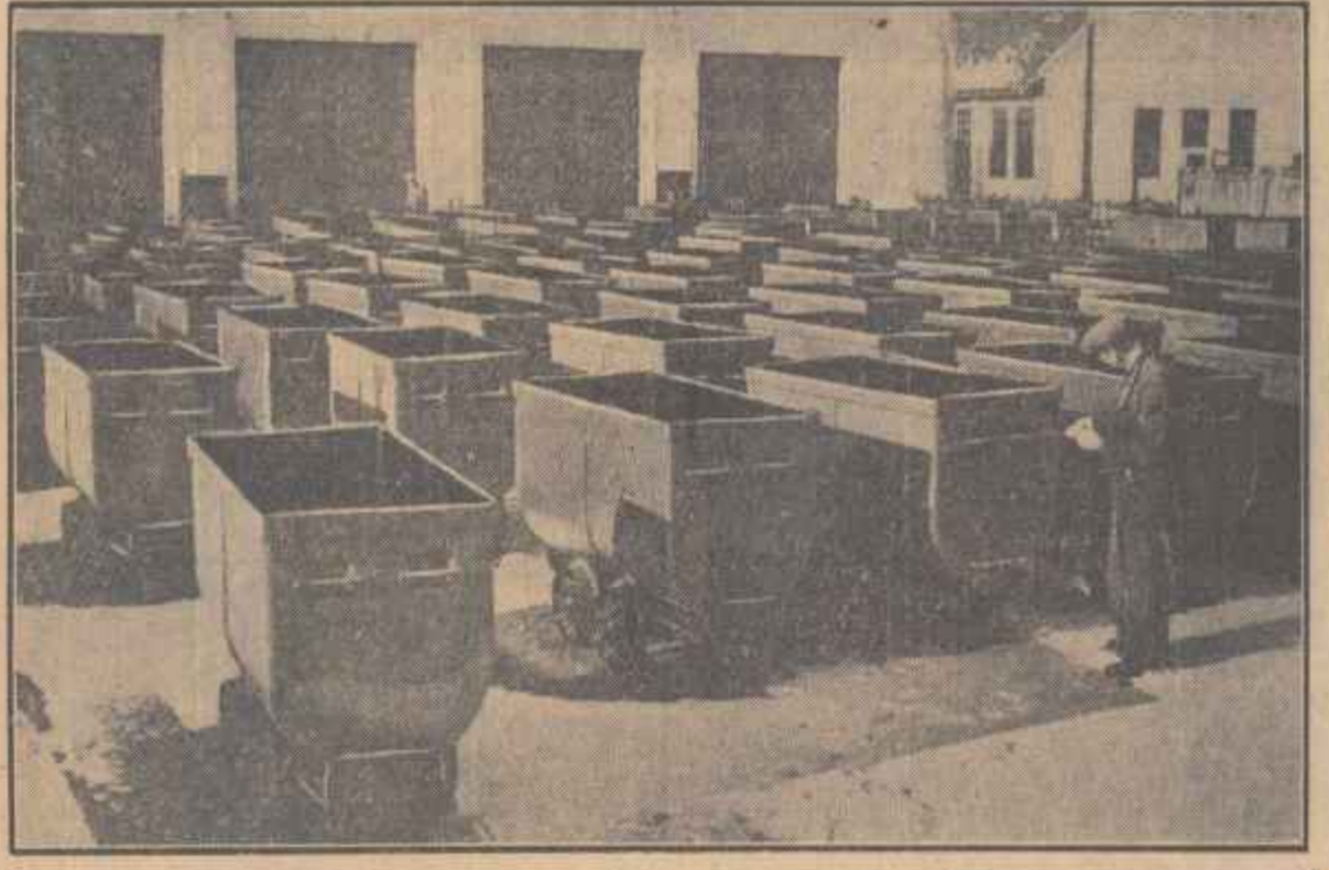
Zilnic pe porțile uzinei „Unio” din Satu Mare ies zeci de vagonete necesari transportului în mine. Muncitorii de aci se străduiesc să producă aceste utilaje de o cit mai bună calitate.

În clișeu: Se fac ultimele verificări la vagonete. Înainte de a fi expediți la diferite mine din țară.