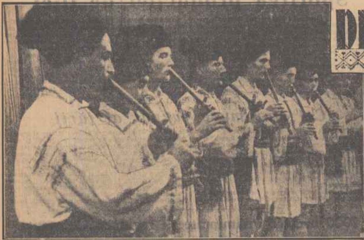
O încercare nouă de a amplifica sonoritatea fluierului a dus la apariția ansamblurilor de fluieri. În clișeu: Ansamblul de fluieri al căminului cultural din Cățina, regiunea Ploiești.