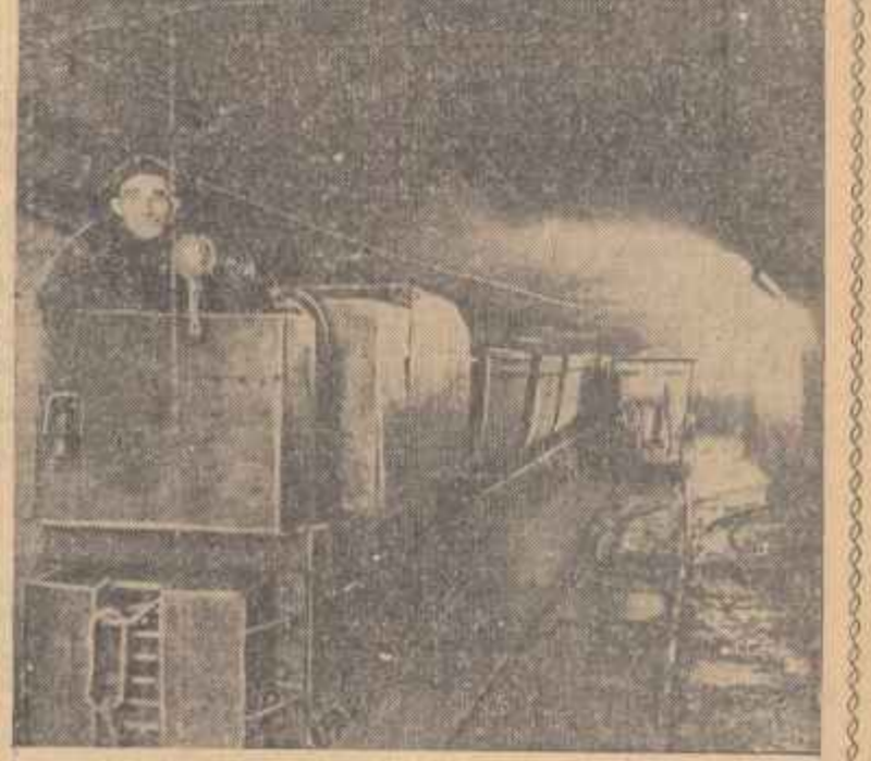
În galeria principală trec pe rînd trenurile încărcate cu minereu. Mecanicul de locomotivă Nicolae Lăzku conduce la suprafață un nou transport, rod al muncii bravilor minerilor.