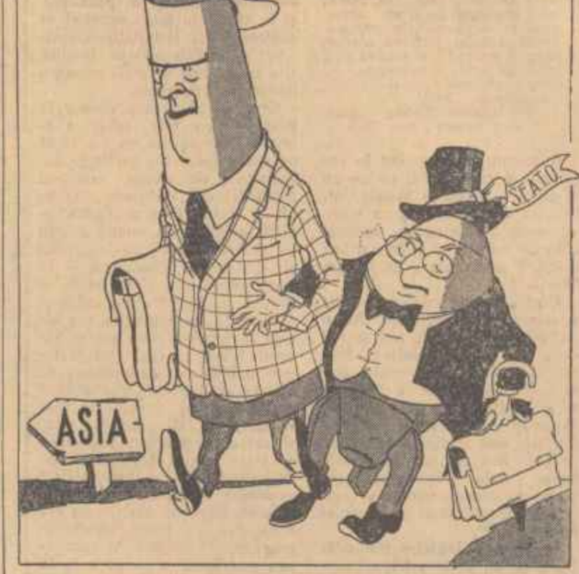
— Ce zici, așa ne mai recunoaște cineva?... desen de NICOLAESCU NIC.

După Consiliul de la Caracii, S.E.A.T.O. și-a accentuat caracterul său... „economic” (Ziarele).