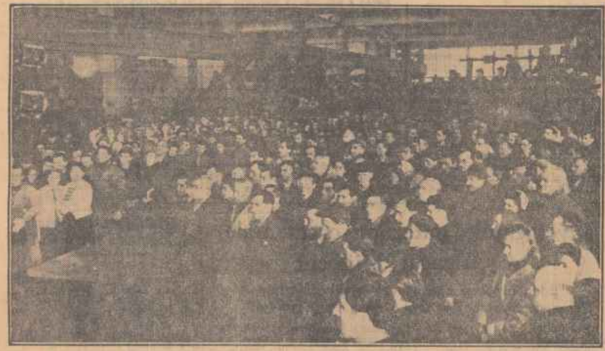
La uzinele „Bolesław Bierut”, în timpul mitingului de doliu

Cu adîncă durere, oamenii muncii din patria noastră au primit vestea înecării din viață a lui Bolesław Bierut, prim secretar al C.C. al Partidului Muncitoresc Unit Polonez. În aceste clipe de grea încercare pentru poporul frate polonez, poporul român își exprimă sentimentele sale de solidaritate și prietenie pe care le poartă Partidului Muncitoresc Unit Polonez, clasei muncitoare și poporului polonez.