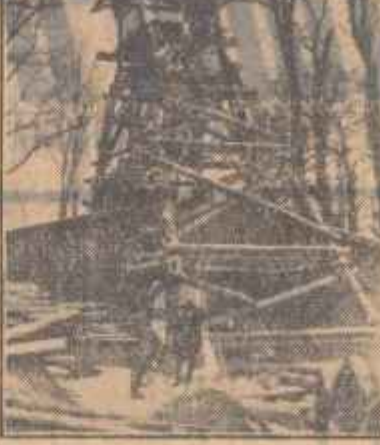
Mina carboniferă Vernest, lăsată în paraisire de capitaliști a fost redeschisă.