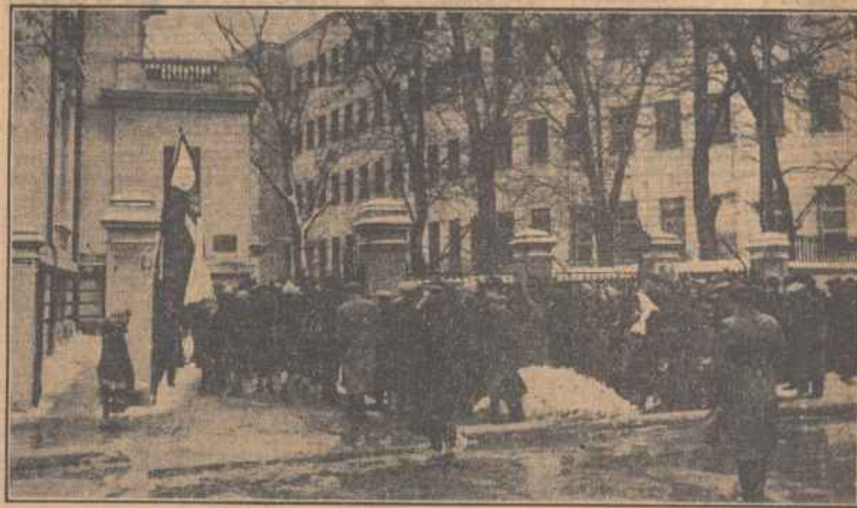
La Ambasada R. P. Polone din București

Vestea înecării din viață a tovarășului Boleslaw Bierut a îndurerat adînc pe oamenii muncii din întreaga țară.