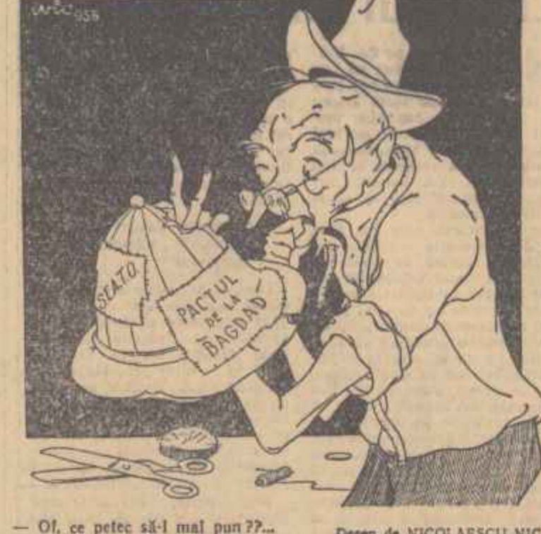
— Of, ce petec să-l mai pun?.. Desen de NICOLAESCU NIC.