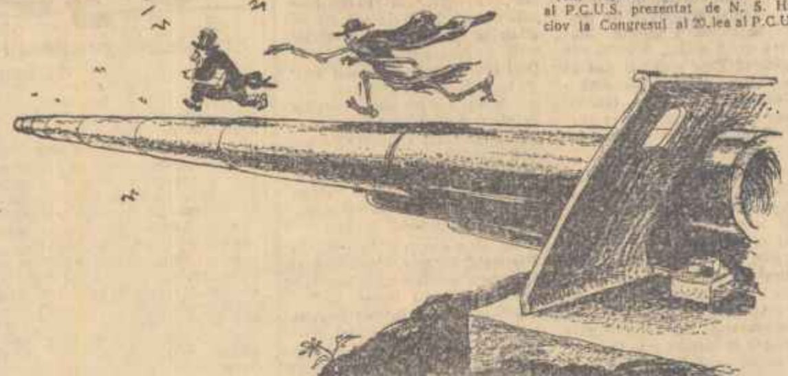
Desen de GIK DAMADIAN

Capitaliștii și apărătorii sașanți ai intereselor lor răs. pândesc „terori” cum că crizele economice pot fi evitate prin lărgirea nelucrată a producției de armament.