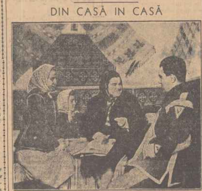
Acum, în preajma alegerilor, agitatorii de la oraș și sate desfășoară o vie activitate... DIN CASĂ ÎN CASĂ

— Vineri 2 martie: informații asupra situației interne și internaționale... Nu e cum se pare