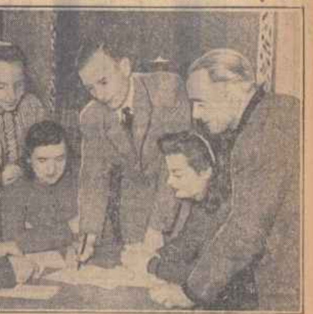
Se întocmește programul de activitate a „Casei alegătorului”.

Am răsfoit programul „Casei alegătorului”. Spectacole artistice, coruri, echipe de dansuri, recenziile de cărți