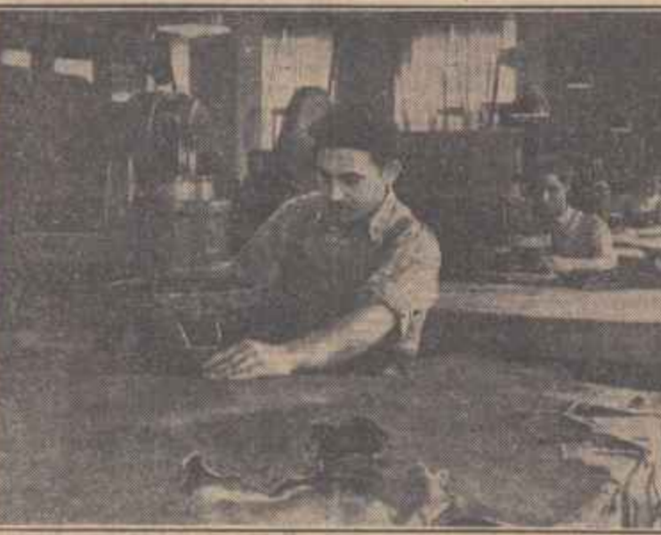
Muncitorii fabricii de piei și încălțăminte „8 Mai” din Medias luptă neobosit pentru a da oamenilor muncii încălțăminte cât mai multă și de bună calitate. Totodată în cadrul acțiunii pentru reducerea sistematică a prețului de cost, economisirea materialelor constituie pentru colectivul acestei întreprinderi un obiectiv central al întrecerii socialiste.