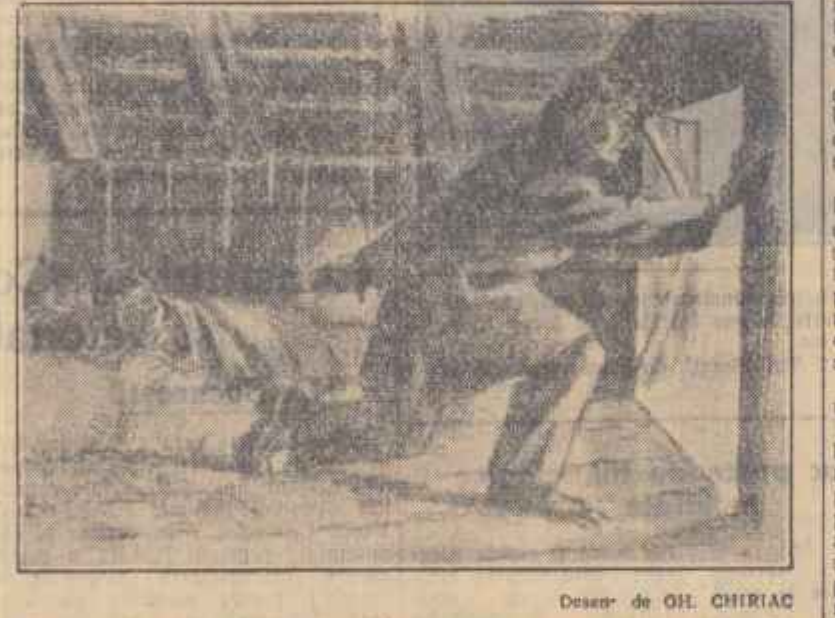
Desen de O.H. CHERIAC

Fragment de intr-un volum în pregătire la E.S.P.L.A.