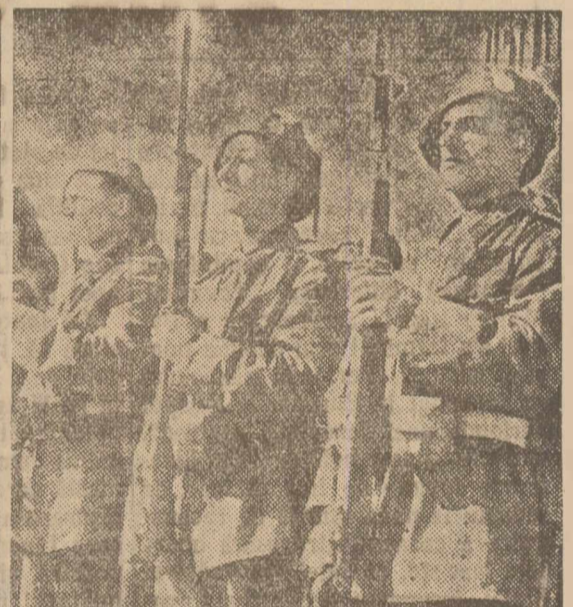
Armata R. P. R. apăra toarea euceririlor democratice ale poporului nostru muncitor, pentru triumful cauzel păcii și a prieteniei între popoare.