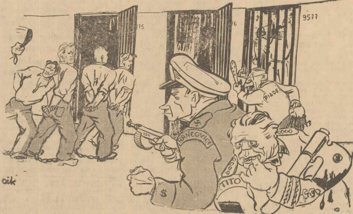
Cetățenii sunt îndreptați spre cabine...

Tot mai mulți patrioți Iugoslavi sunt inchiși și schingiuți de cãlia Tito-Rankovici.