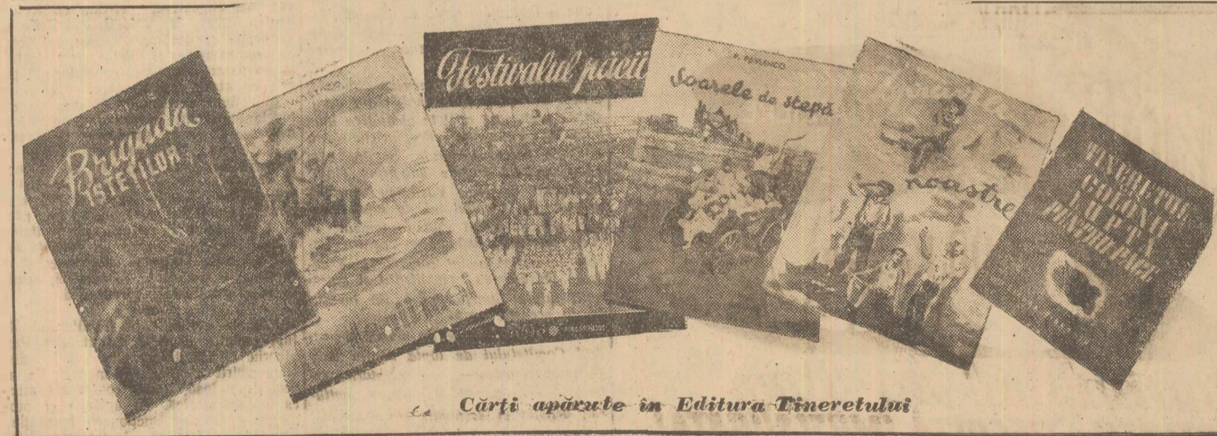
Cărți apărute în Editura Tineretului

La Timișoara, Oradea, Cluj, St. Gheorghe, Brașov, Brăila, Roman și Ploești au început ieri finalele etapelor de sector din cadrul campionatelor naționale de tenis de masă. S'au disputat matchurile pe echipe, iar azi se dispută concursurile individuale. Jucătorii bucureșteni participă la concursurile ce se desfășoară la Ploești. Primele patru formații masculine, primele patru feminine, 16 jucători și 10 jucătoare, se vor califica pentru faza de zonă, care se va disputa la 1-2 Aprilie în București.