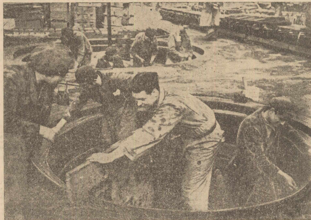
Brigada U.T.M. dela secția turnătorie oțel a uzinelor „23 August”, s'a evidențiat prin calitatea lucrărilor executate. Cilșeul nostru îi arată pe tinerii brigadieri în timpul operațiilor de modelare a gropii de pământ. (Reportajul în pag. 3-a).