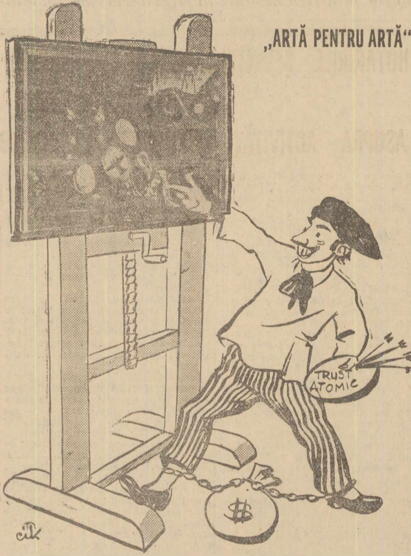
Întâ-l pe pictorul Salvador Dali pictând în deplină „libertate” tabloul denumit „Baseball și uranium în acțiune”.

În 1941 Valtin a fost arestat de către organele contraspionajului american. La judecată s'a stabilit că pătrunsese în U.S.A. în chip ilegal ca agent nazist și că încercase să-și ucidă creditorul, un oarecare negustor din Los Angeles. După câteva luni numai, Valtin era primit în armata americană. Actualmente, el se „distinge” în calitate de colaborator al serviciului de informații și ca autor de cărți antisovietice.