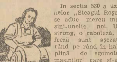
In secția 530 a uzinelor „Steagul Roșu” se aduce mereu mașinile noi. Un strung, o raboteză, o freză sunt așezate rând pe rând în hala plină de șgomotul mașinilor care și-au început lucrul.

Muncitorii și muncitoare, tehnicienii și inginerii depun toată priceperea, toată dragostea lor în instalarea mașinilor noi, pentru ca secția 530, să poată răspunde cu cinste sarcinilor ce-i revin din planul uzinelor.