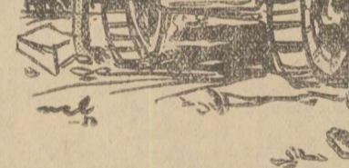
Un sat la mine și le-o arăta eu chiaburii să mai umble cu minciuni și cu uneltii...”