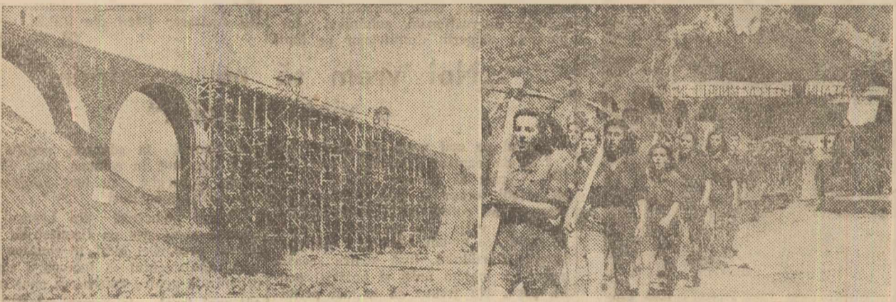
Întreaga Bulgaria s'a transformat astăzi într'un imens șantier. Poporul bulgar lichidează moștenirea rușinoasă lăsată de trecutele regimuri de exploatare.

Un avânt considerabil a luat industria construcțiilor de mașini, o ramură cu totul nouă a economiei bulgare. În cursul primului an al planului cincinal au fost construite 70 tipuri de mașini care nu se produceau mai înainte în țară. S'au construit primele autocamioane, primele freze, furbinde de apă, frezătorii și alte mașini. Uzina „Marea