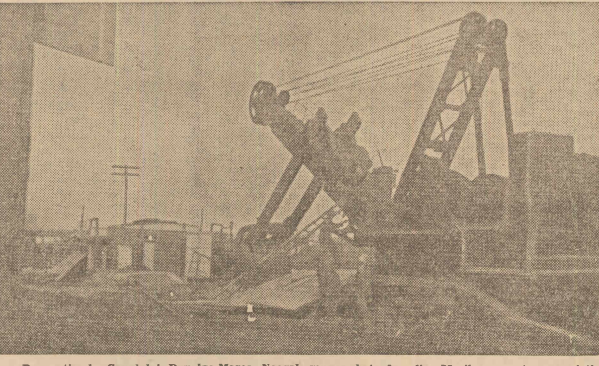
Pe șantierele Canalului Dunăre-Marea Neagră munca bate în plin. Marile escavatoare sovietice de 3 m, au intrat în acțiune. Iată una din aceste uriașe mașini pe șantierele Mircea Vodă.