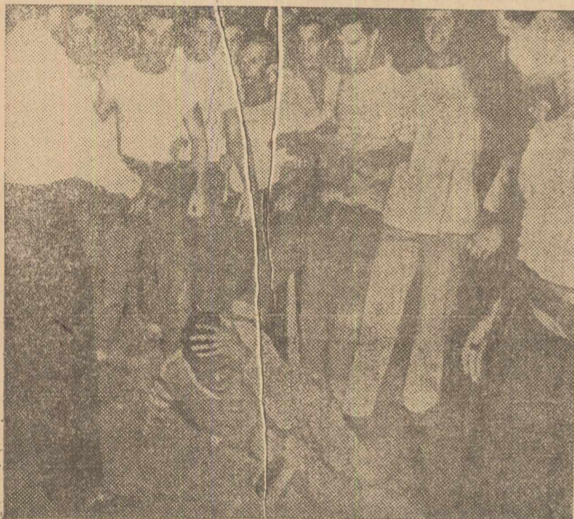
Fotografia noastră reprezintă un aspect al „modului de viață american”, modul de viață al rasismului săbatic, al linașului și mizeriei. Iată un cetățean al Statelor Unite, din St. Louis, atacat în plină stradă, bătut și isbit cu pietoarele de neofasciști americani ai d-lui Truman. Vina acestui cetățean? Acela de a fi negru.

„Civilizația” aceasta vor canibalii din Wall-Street s'o impună lumii prin război.