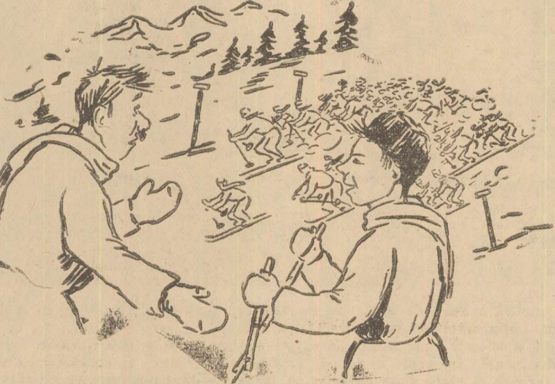
— De ce s'a întâmplat de au eșii atâtia sportivi cu skiuri? — Se alegea Campionatul Popular de Cross pe Ski. — Ia uite mai bine și-mi mlați un secret tovarășii dela UTM!

Asociațiile și colectivele sportive dela orașe trebuie să-și înscrie în planurile lor de muncă repetate deplasări demonstrative, pe în satele din apropiere, mai ales în această fază de organizare a sportului rural.