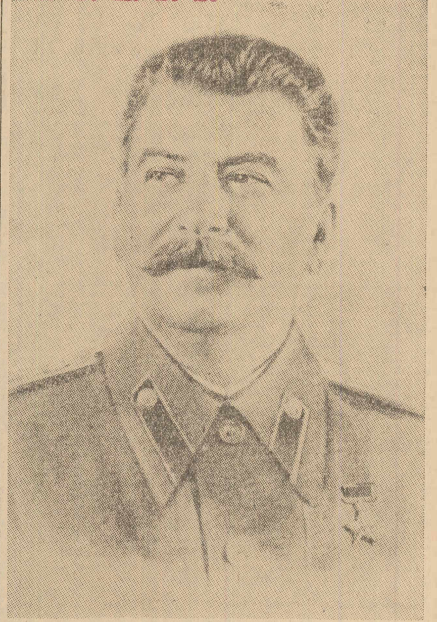
IOSIF VISSARIONOVICI STALIN

a propus ca Viaceslav Mihailovici Molotov membru în Biroul Politic al Comitetului Central al Partidului Comunist (b) al URSS și vicepreședinte al Consiliului de Miniștri al URSS, să fie ales candidat pentru Sovietul Suprem al URSS. Împreună cu Lenin și Stalin, a arătat Kukoleva, — tovarășul Molotov a luptat pentru răsturnarea puterii capitaliștilor și moșterilor și pentru crearea