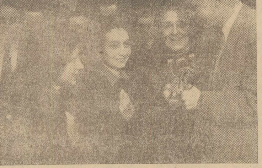
Cele trei componente ale echipei R.P.R. vorbesc la microfonul postului de radio Budapesta, dupa victoria lor in campionatul mondial de tenis de masa.

Sido-Soos (R.P.U.) - Andreadis-Tokar (R. Cehi) 3-1 (15-21, 21-18, 21-13, 21-18).