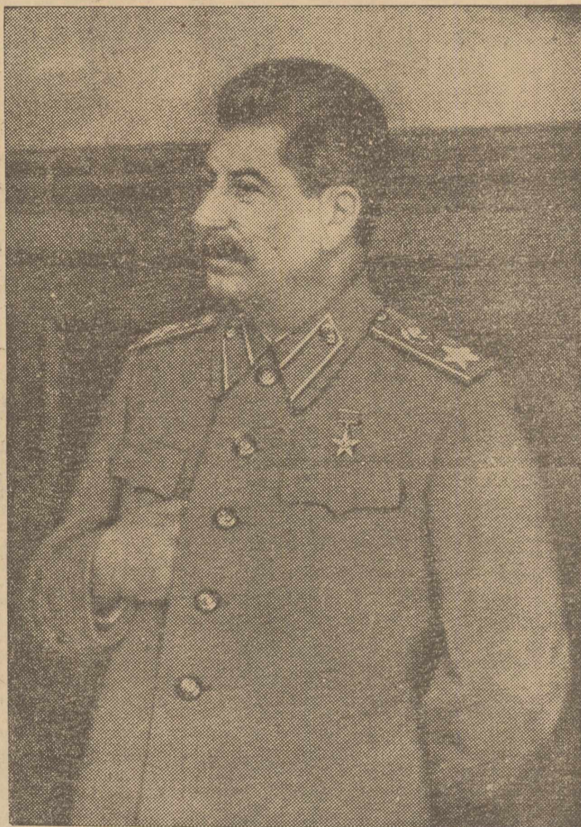
GENERALISSIMUL I. V. STALIN Organizatorul și făuritorul măreței victorii dela Stalingrad

MOSCOVA 1 (Agerpres) — TASS transmite: Printr'un decret al Prezidiului Sovietului Suprem al URSS, scriitorul Alexei Surkov a fost decorat, cu prilejul împlinirii a 50 de ani, cu Ordinul Lenin pentru merite excepționale în domeniul literaturii.