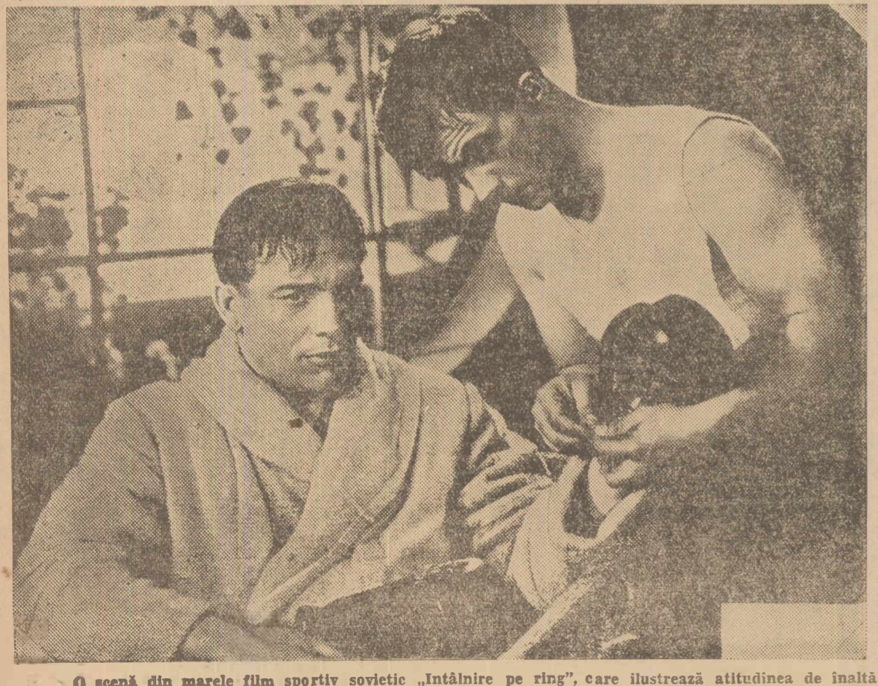
O scenă din marele film sportiv sovietic «Întâlnire pe ring», care ilustrează atitudinea de înaltă moralitate a omului sovietic în chestiunile sportive.