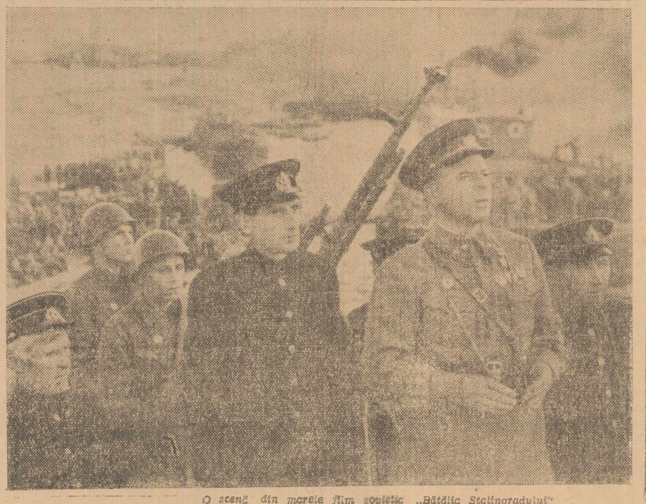
Q scenă din marea șim socială „Gătită Stalingradului”

Pentru viitor, credem că e datorle cenacului să intensifice activitatea organizatorică pe terenul manifestărilor externe (sezațori, conferințe, etc.). Să găsească de comun acord cu organizațiile de masă și Comiteele Provizorii, o soluție pentru a se găsi timp liber elementelor muncito-