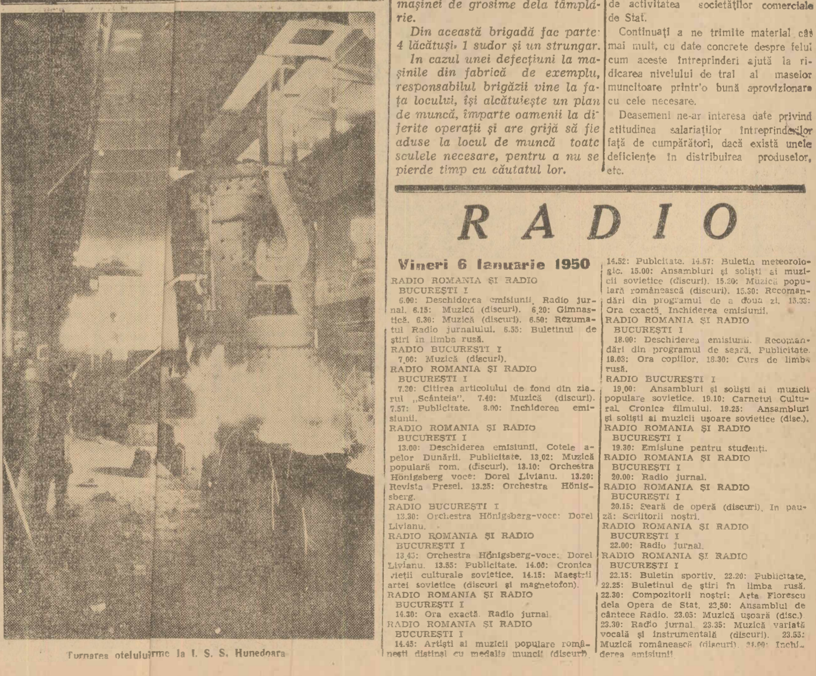
Turnarea otelului în la I. S. S. Hunedoara