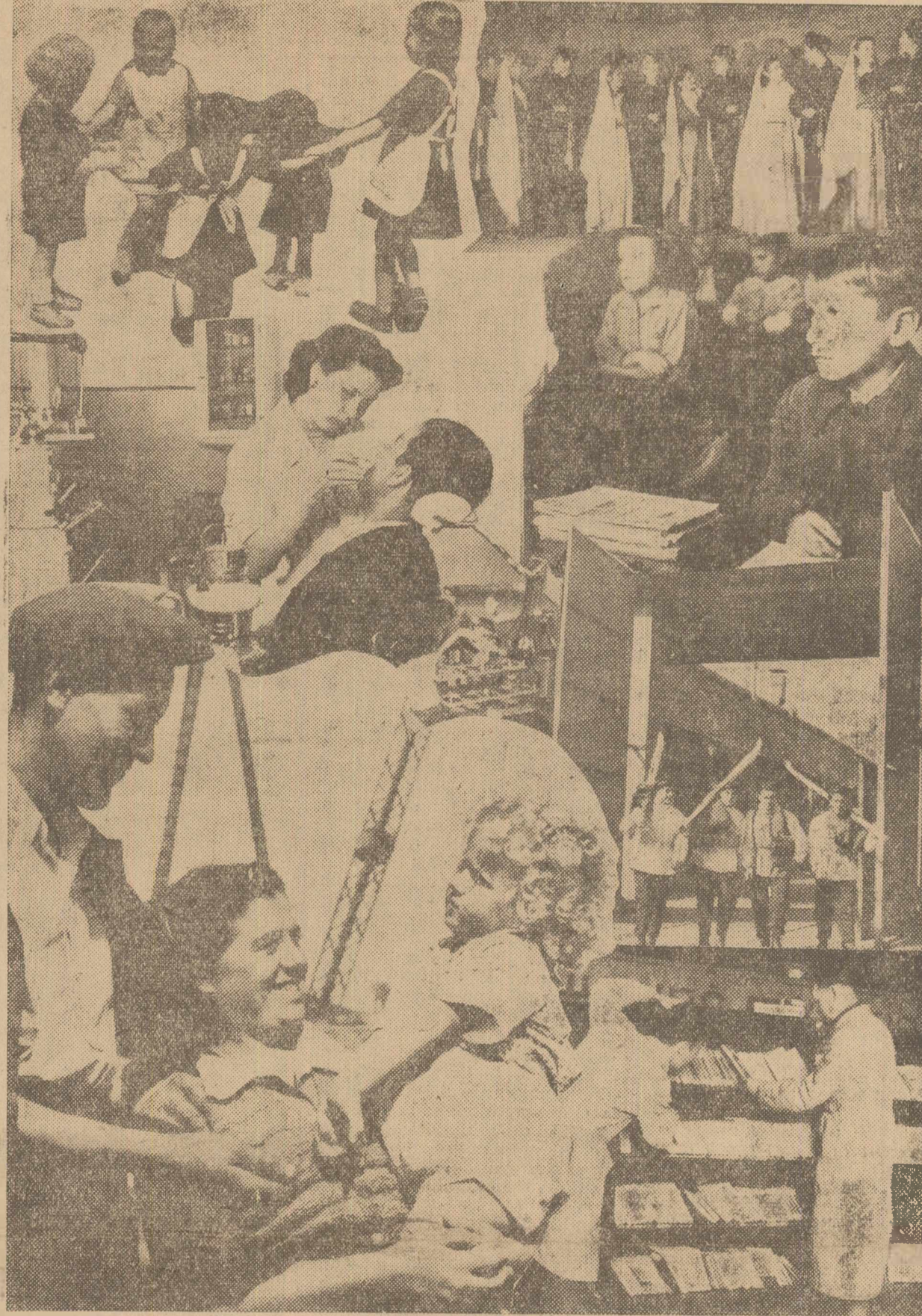
ÎN ANUL 1949 VOLUMUL TOTAL AL SALARIULUI SOCIAL A FOST DE 22 MILIARDE LEI...

INSUMAND TOATE AVANTAGIILE CE LE ACORDA STATUL NOSTRU DE DEMOCRA- ȚIE POPULARĂ OAMENILOR MUNCII SUB RAPORTUL POSIBILITAȚII DE ÎNVAȚAMANT GRATUIT, ASISTENȚA MEDICALĂ GRATUITĂ, CONGEDII DE BOALĂ ȘI ODIHNA, AJUTAO- RE DE BOALĂ ȘI DE NAȘTERE, PRIN CAMINE CULTURALE, BIBLIOTECI, GINEMATOGRAFE, TEATRE, RADIO, POSIBILITATEA DE SPORT ȘI ÎN FINE PRIN CANTINE, CAMINE ȘI CREȘE — ÎNSEAMNA GA SALARIUL SOCIAL ADUGE AZI UN PLUS DE CIRCA 20% LA SALARIUL MEDIU PE GARE-I. PRIMESC OAMENII MUNCII DIN ȚARA NOASTRĂ. (Din raportul făcut de tov. Miron Constantinescu, membru în Biroul Po- litic al C.C. al P.M.R., președintele Comisiei de Stat a Planificării, asupra re- zultărilor Planului de Stat pe 1949).