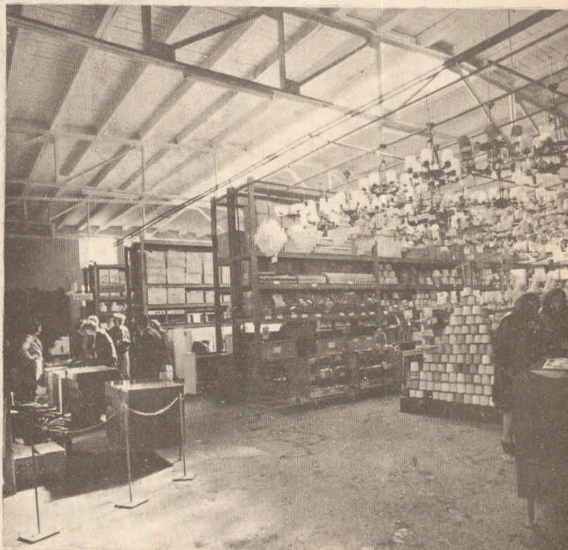
Magazinul din bd. Emil Bodnăraș nr. 84