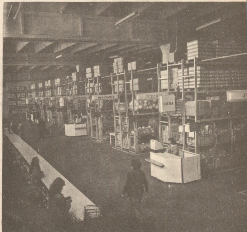
Magazinul din șos. Viilor nr. 14

Asigurăm pe cumpărători că aceste unități comerciale vor satisface cele mai exigente gusturi.