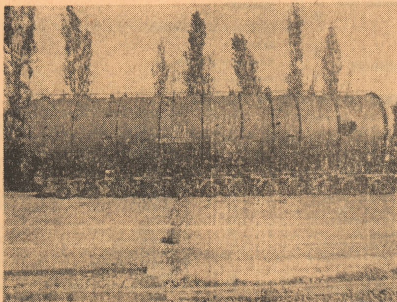
Coloană de distilare pentru combinatele petrochimice

În 1976, municipiul Buzău a aniversat 1600 de ani de atestare documentară. Dar numai în ultimele decenii Buzăul a devenit un puternic centru economic.