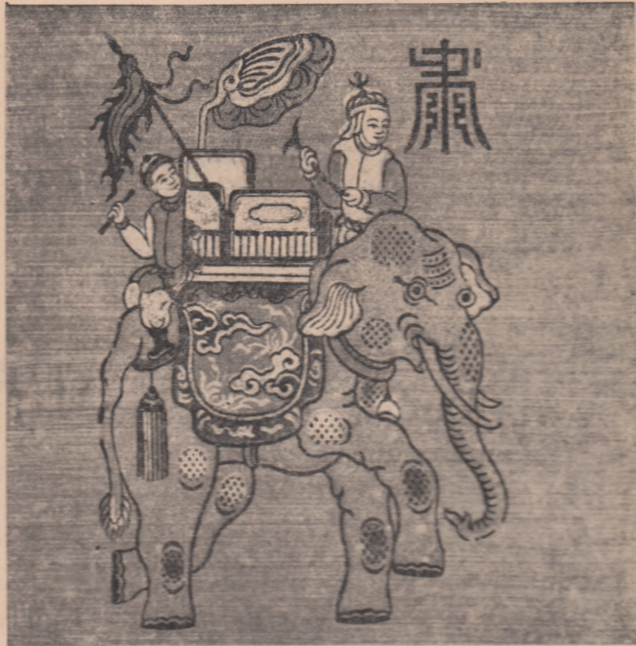
Gravura populara vietnameza