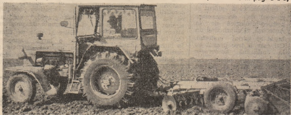
Pe ogoarele C.A.P. Deva se lucrează cu spor la pregătirea patului germinativ, accentul punându-se pe calitatea discuitului.