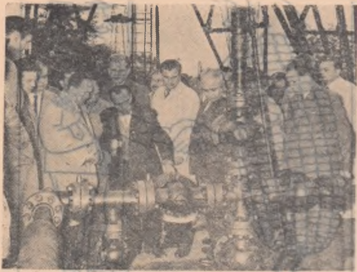
Delegația Selmului R. P. Polone în vizită la schela petroliferă Băicoi