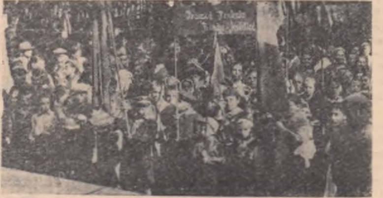
Aspect din timpul festivității

Pînă tîrziu seara cînd întunericul a fost luminat de făclia sutelor de torțe, ulițele comunei Titu-Tirg au răsunat de cîntece rominești și sovietice, mărturie a dragostei și prieteniei pentru marele popor sovietic.