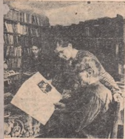
"rd" din raionul Beloiarsk, regiunea Sverd- ecă sătească cu o sală de lectură. Biblioteca teva mii de cărți, de reviste și ziare. lectură a bibliotecii.

a mase- ovietelor periență. instrucției firm ex-