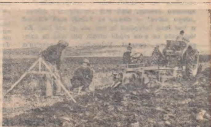
La gospodăria colectivă din Sofrănești, raionul Negrești, regiunea Iași, arăturile deloamnă sînt pe terminate.