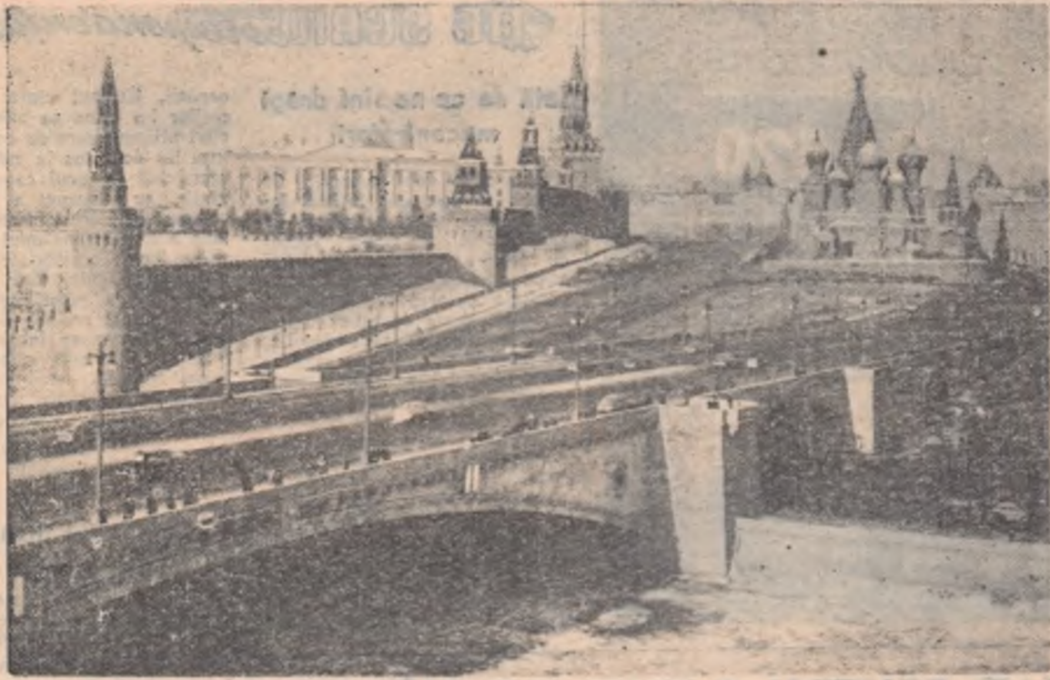
Vedere din Moscova