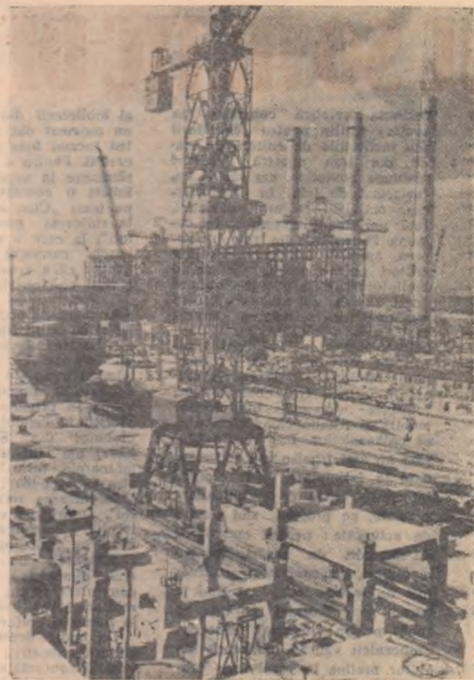
Uzina electrică a combinatului de cocs „Schwarze Pumpe” din R. D. Germană care va fi cel mai mare combinat de cocs din Europa.

Pe șantierul imens al termocentralei lucrează 1.600 de muncitori constructori, care imprimă lucrărilor un ritm rapid de execuție. Cartierul delocuințe al muncitorilor de la această termocentrală va fi alcătuit din 71 de blocuri cu 2.187 apartamente, două școli, un magazin universal, două grădinițe de copii, două creșe, o policlinică și un centru sportiv.